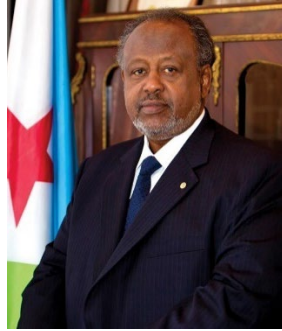
นาย Ismaïl Omar Guelleh